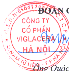
Ông Quách Hữu Thuận